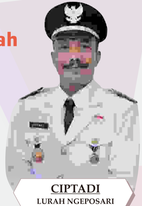
CIPTADI LURAH NGEPOSARI